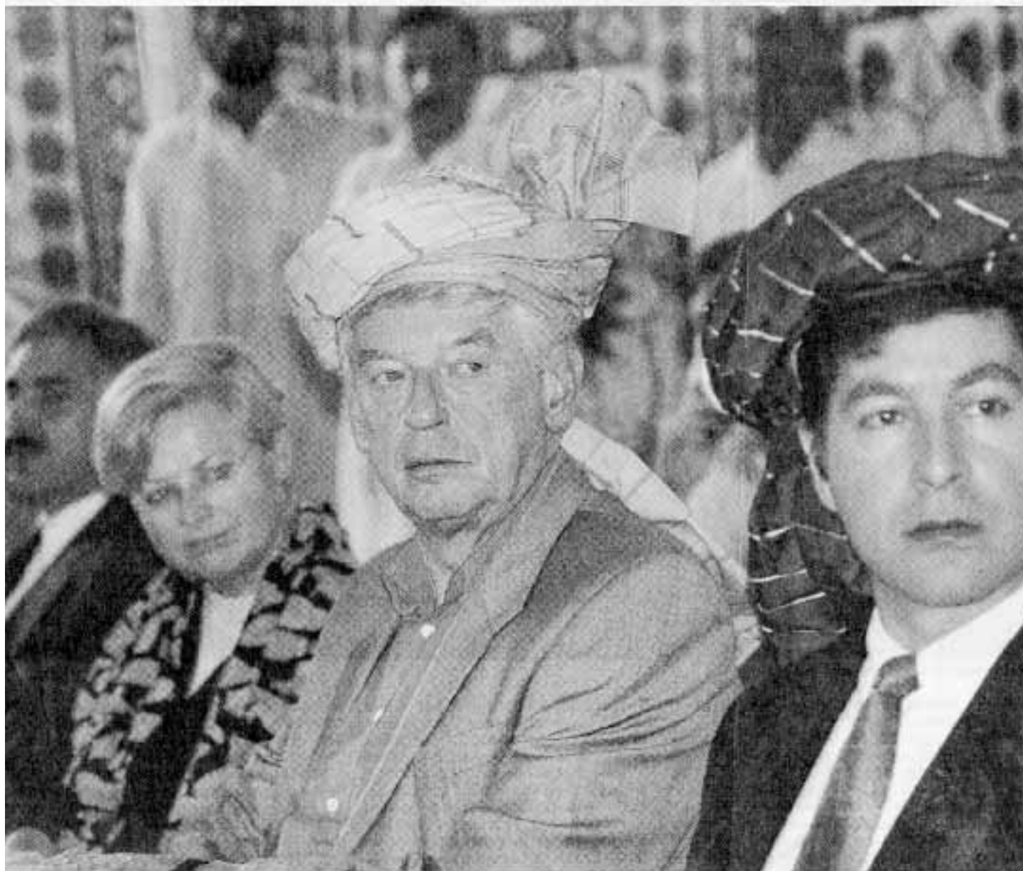
istan een kamp voor Afghaanse vluchtelingen. Hij betuigde dit wekeinde bij president Musharraf zijn steun en pleitte voor Afghanistan. Minister Herfkens, ook op bezoek, schold Pakistan 40 miljoen gulden kwijt. Verslag op pagina 3.

020-362.1222 / BEZORGINFORMATIE 020-654.1111 / FAX REDACTIE 020-542.4289 / E-MAIL: REDACTIE@VOLKSKRANT.NL / DE VOLKSKRANT OP INTERNET: WWW.VOLKSKRANT.NL